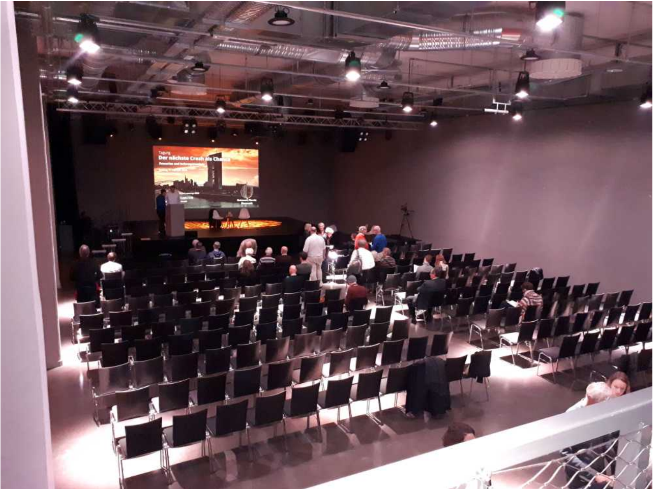
Der Veranstaltungsraum kurz vor der Tagung